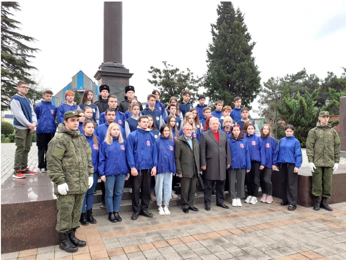
Воспитатель 32 учебной группы